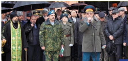
В честь легендарного генерала