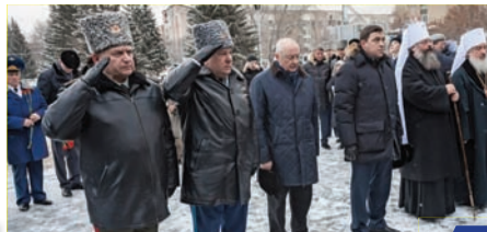
Подвигом возвеличится Россия!