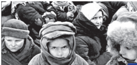
Об этом нельзя забывать!