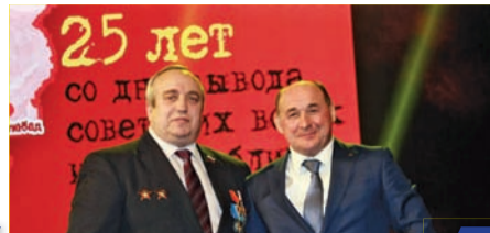
«Людскую боль пропускаешь через сердце»